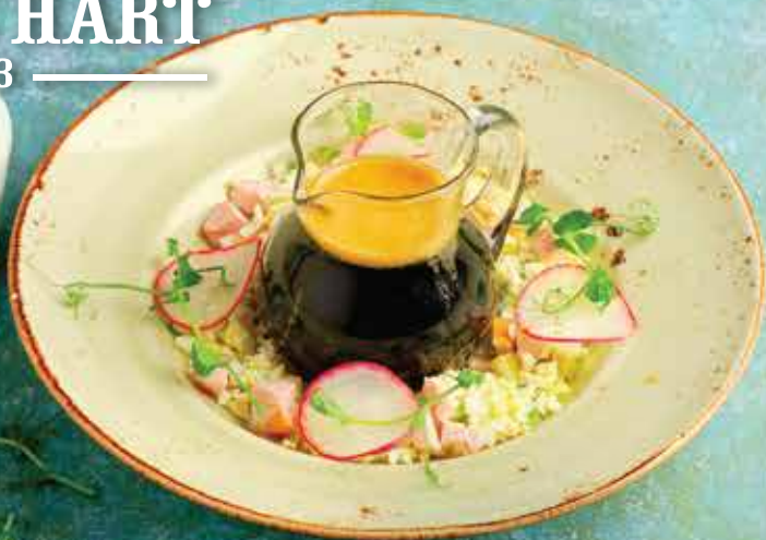
ОКРОШКА на квасе/ на кефире 320 ₽