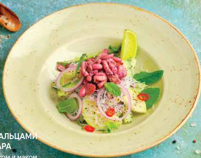
САЛАТ С ЩУПАЛЬЦАМИ МИНИ КАЛЬМАРА с фунчозой, яблоком и маком 490 ₽