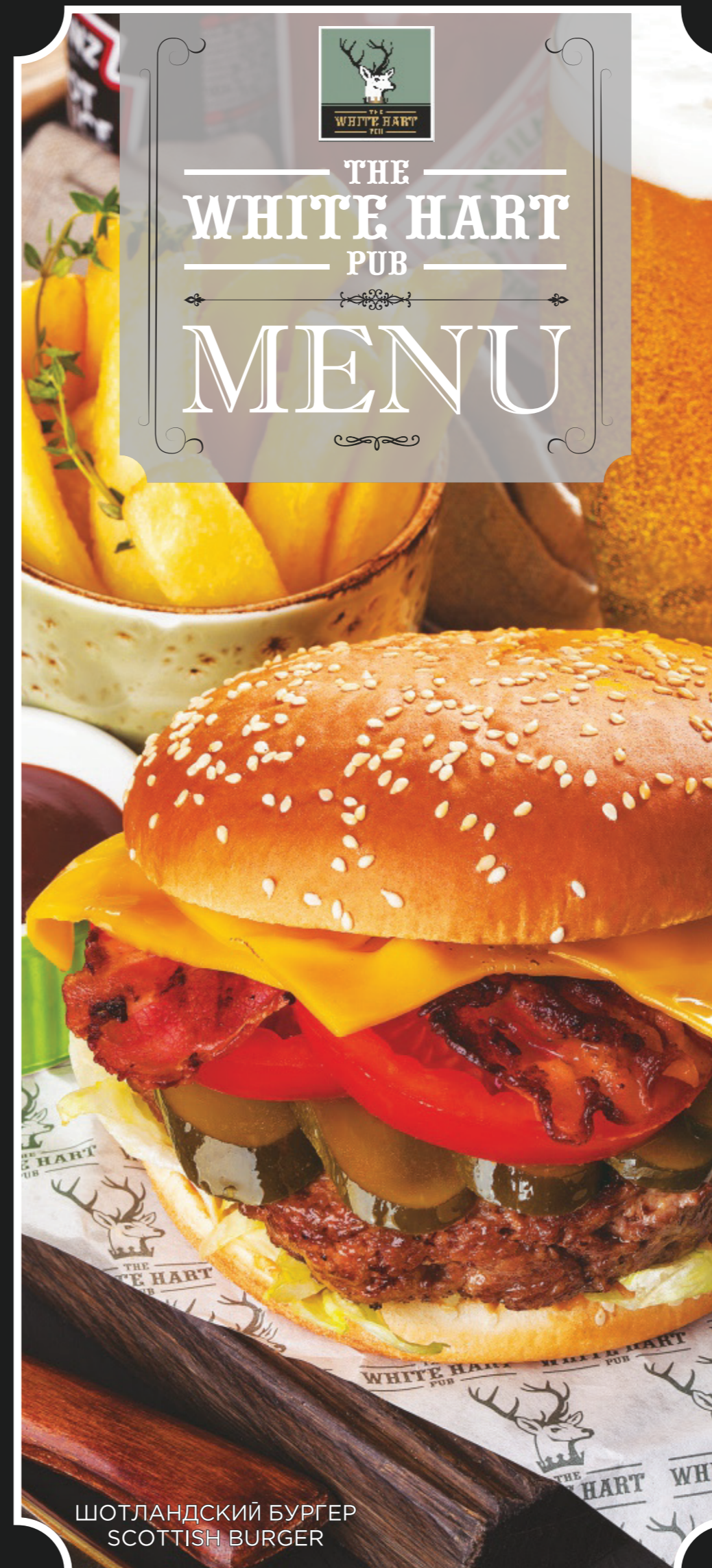
ШОТЛАНДСКИЙ БУРГЕР SCOTTISH BURGER

This printed booklet is for advertise purpose. Please ask the manager for detailed menu. All prices are given in rubles, VAT included. We accept rubles only and main cards.